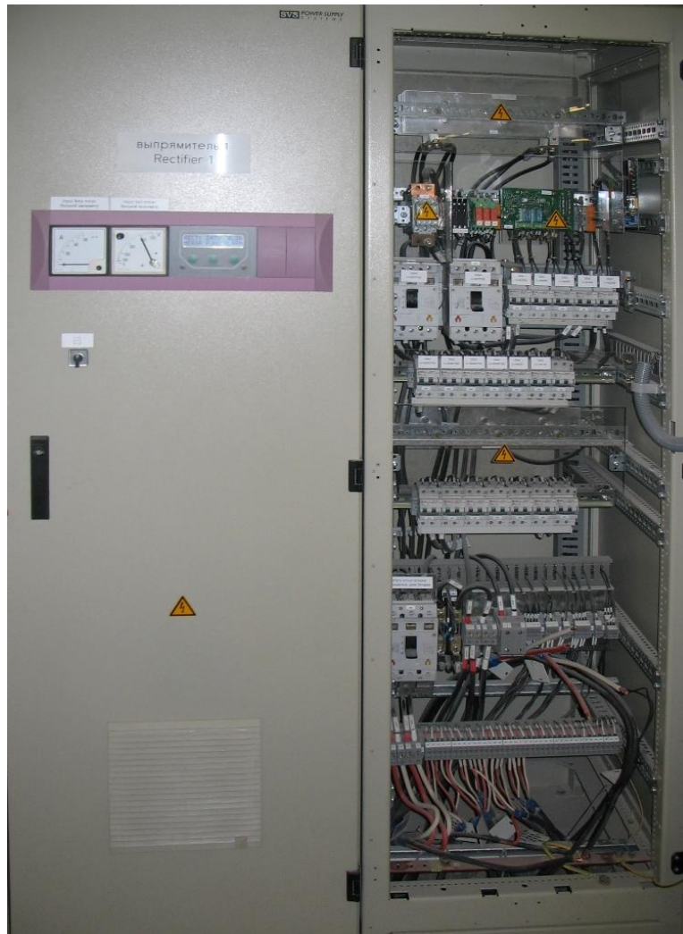
Две параллельные системы TPR