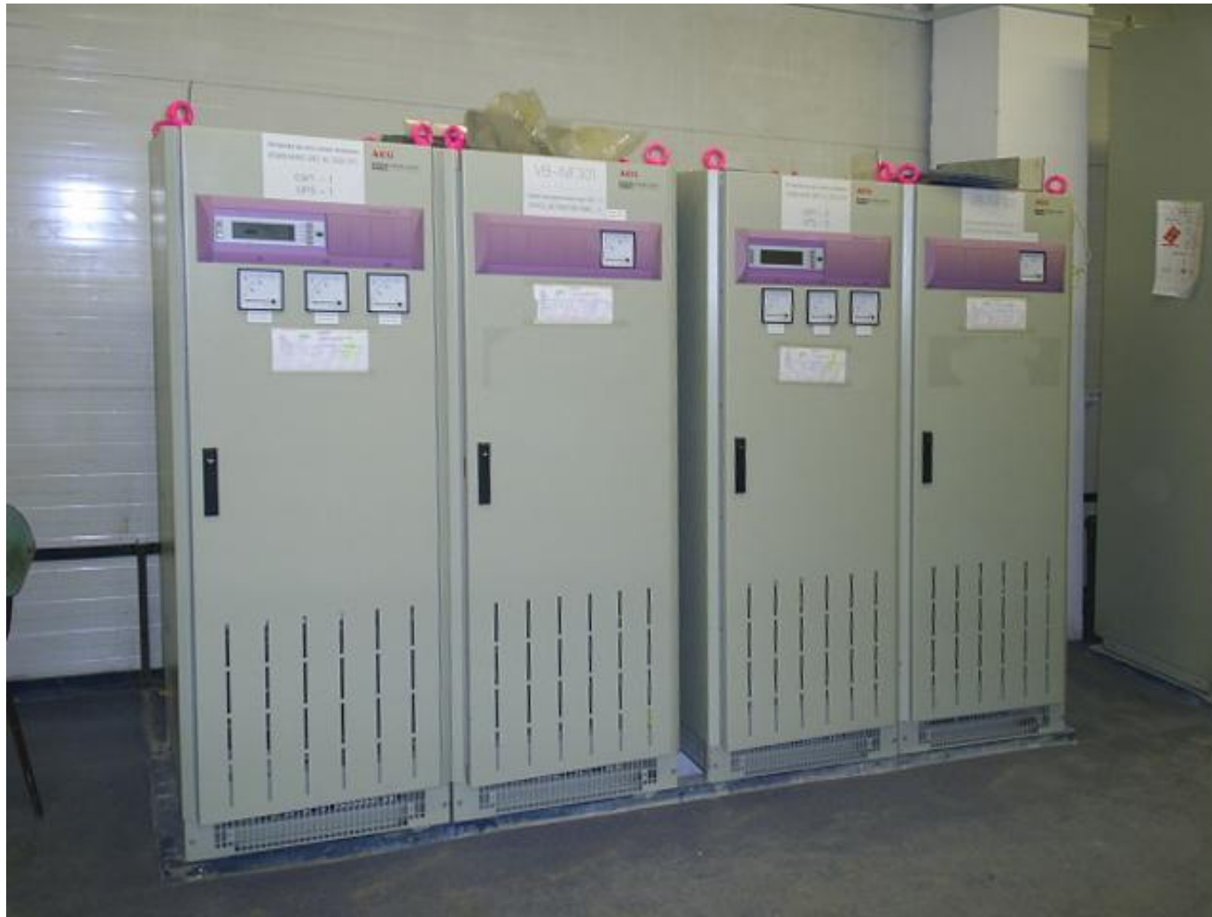
Систем Protect 3.31-80kVA в параллель