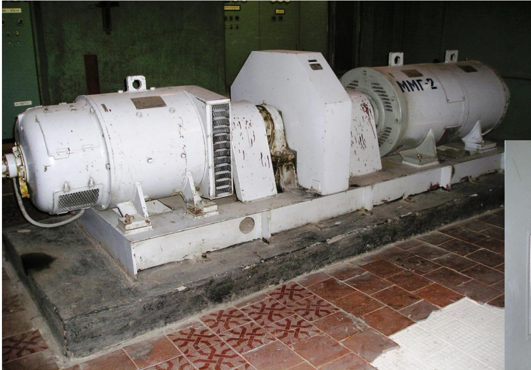
Мотор - генератор